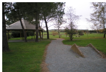
Parcours de santé